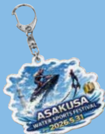
※商品画像はイメージです。