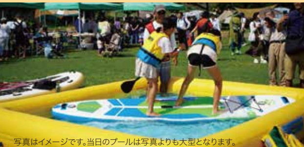
写真はイメージです。当日のプールは写真よりも大型となります。